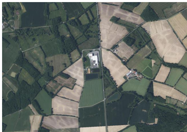
Situation générale de l'entreprise 1

Le site occupe une superficie de 56 653m 2