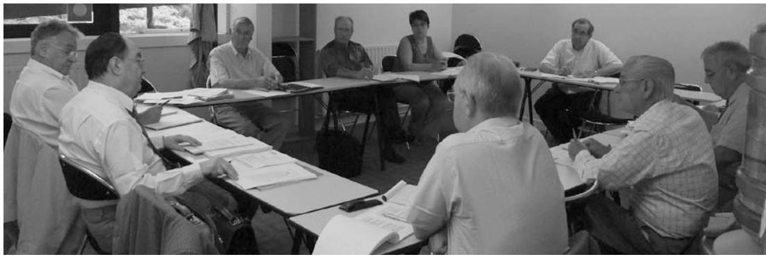
2 septembre 2009 à Paris : réunion entre les membres du bureau de la CNCE et les membres du groupe de travail « livre blanc ».

radié de cette liste tout commissaire-enquêteur ayant manqué aux obligations définies à l'article L.123-15. »